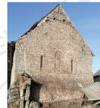
Pignon Est - Triplet Roman