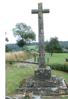
Croix de Granit

Le maître d'ouvrage s'engage à affecter l'ensemble des dons à un projet de sauvegarde du patrimoine sur le territoire de la commune ou du département, pour le cas où le projet de restauration n'aboutirait pas. La Fondation du Patrimoine s'engage à reverser au maître d'ouvrage les sommes ainsi recueillies nettes des frais de gestion évalués forfaitairement à 5% du montant des dons reçus en paiement de l'impôt sur la Fortune et à 3% du montant des autres dons.